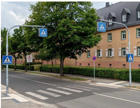
Rudolf-Krahl-Straße Ecke Berganger

Wir wollen den Fußgängerinnen und Fußgängern neue Wege bereiten. Auch in dieser Amtszeit setzten wir uns für mehr sichere Fußgängerüberwege im Stadtgebiet ein. Der öffentliche Raum ist für alle da, nicht nur für Kraftfahrzeuge. Hier geht es nicht nur um Sicherheit und Barrierefreiheit, sondern auch um Lebensqualität. Es gehört zu einer attraktiven und belebten Stadtumgebung einfach dazu, gefahrlos die Straßenseite wechseln zu können. Da geht in Chemnitz noch mehr. Dank unserer Anträge und dem damit verbundenen Geld konnten wir einen großen Erfolg erzielen und dafür sorgen, dass im gesamten Stadtgebiet mehr Zebrastreifen geschaffen werden. Ein wichtiger