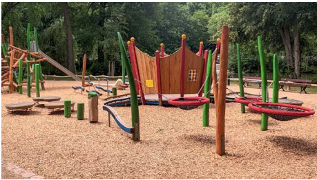
Der neue Spielplatz am Schlossteich

Freude am Spielen. Es ist wichtig, dass alle Kinder die gleichen Möglichkeiten haben, sich an Spiel und Sport zu beteiligen. Inklusive Spielgeräte erlauben, dass es für alle Kinder zum Beispiel auch im Rollstuhl leicht ist, sich darin zu bewegen und zu spielen. Auf unsere Initiative wird die Stadt bei ihren jährlichen Neugestaltungen von Spielplätzen künftig mindestens ein solches Spielgerät einplanen und umsetzen. Ziel ist, dass in jedem Stadtteil mindestens ein Spielplatz mit inklusivem Spielgerät ausgestattet wird und somit alle Kinder die Möglichkeit haben, gemeinsam zu spielen und Spaß zu haben.