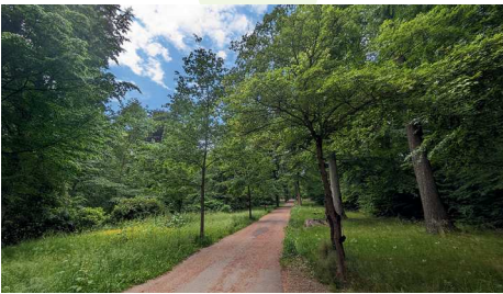
Küchwald mit Jungbäumen

Unsere Stadtwälder sind zunehmend schwierigen klimatischen Bedingungen ausgesetzt und auch der Schädlingsbefall nimmt zu. Die Wetterereignisse der vergangenen Jahre und die weitere Ausbreitung des Borkenkäfers hat auch im Chemnitzer Kommunalwald deutliche Spuren hinterlassen. Er ist in